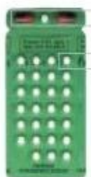
PB cartelas adulto

Orientar sobre o uso da medicação (dose diária ou supervisionada), preferencialmente no período da tarde, duas horas após o almoço, ou à noite, antes de dormir.